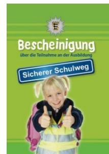
Abbildung 6 Kinderfußgängerschein

Mit theoretischen und praktischen Übungen mit Vor- und Grundschulkindern unterstützen Beamtinnen und Beamte der Verkehrsprävention Eltern dabei, ihren Sprösslingen die Gefahren im Straßenverkehr aufzuzeigen.