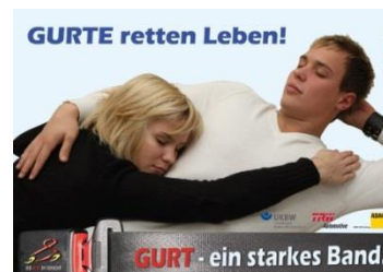
Abbildung 2 - GIB ACHT IM VERKEHR - Gurte retten Leben

Jedes Jahr sterben Menschen im Straßenverkehr, weil sie nicht angegurtet waren (gut ein Viertel der gurtpflichtigen Getöteten). Die Kräfte, die selbst bei geringen Geschwindigkeiten wirken, werden teilweise völlig unterschätzt. So entspricht ein Aufprall mit Tempo 50 einem Sturz aus 10 Metern Höhe. Wer sich mit einem Auto nicht angeschnallt fortbewegt, nimmt diese Gefahr in Kauf. Vernünftigerweise wären jene wohl kaum bereit, bei einer zügigen aber im Vergleich geringen Schrittgeschwindigkeit von 6 km/h ungebremst auf eine Wand zuzugehen, bis es zum Anstoß kommt.