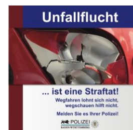
Abbildung 4 Gib Acht im Verkehr „Unfallflucht ist eine Straftat“

Immer wieder passiert es, dass sich jemand, selbst bei Schulwegunfällen mit verletzten Kindern, unerlaubt vom Unfallort entfernt. Auch wenn z. B. ein Kind nach einem Unfall sagt, dass nichts passiert sei, melden Sie den Vorfall unbedingt der Polizei, denn unter dem Eindruck eines zutiefst erschreckenden Zusammenstoßes sind Schmerzen ggf. noch nicht spürbar.