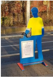
Abbildung 5 Verkehrsmännle des PP Stuttgart

Wenn zu Fuß Gehende einen Unfall verursachen, indem sie beispielsweise ein Rotlicht missachten oder eine Straße unachtsam überqueren, stellen wir für die Dauer von einer Woche ein sogenanntes „Verkehrsmännle“ auf, mit dem auf die Gefahrenstelle hingewiesen und bei Bedarf nach Zeugen gesucht wird.