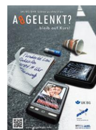
Abbildung 1 - DVR e.V. - ABGELENKT? ... bleib auf Kurs!

Vom Verkehrsgeschehen durch verkehrsfremde Tätigkeiten (bspw. Bedienung eines Smartphones) abgelenkte Personen gefährden andere und sich selbst. Der Mensch wird immer Fehler machen; für Ablenkung in der hier beschriebenen Art und Weise gibt es aber keine Entschuldigung!