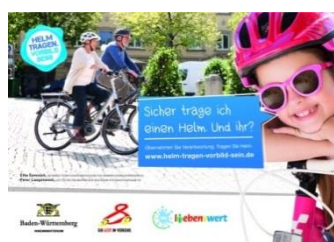
Abbildung 3 - GIB ACHT IM VERKEHR - Helm tragen, Vorbild sein

Diese Einsicht führt auch noch längst nicht in ausreichendem Maße zu dem Entschluss, beim Radfahren einem Helm zu tragen, selbst wenn keine Helmpflicht besteht.