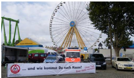
Abbildung 3 Präventionsstand des PP Stuttgart beim Volksfest

Bekanntermaßen beeinträchtigt der Konsum von Alkohol und Drogen die Fahrtauglichkeit. Medikamente und Müdigkeit können ähnliche Auswirkungen haben. Es ist unverantwortlich, aufgrund eigener Bequemlichkeit trotz beeinträchtigter Fahrtauglichkeit die Sicherheit der Mitmenschen aufs