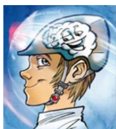
Abbildung 12 Gib Acht im Verkehr – „Schütze Dein Bestes“

Insbesondere für die Schulwege zu weiterführenden Schulen kommen verschiedene Verkehrsmittel in Betracht. Rad, Bus oder Stadtbahn können nun zum alltäglich genutzten Verkehrsmittel werden. Daher sollten Sie mit Ihrem Kind – genauso wie in der Grundschule – den Schulweg gemeinsam erkunden, auf Gefahrenstellen hinweisen,