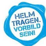
Abbildung 10 Gib Acht im Verkehr – „Helm tragen. Vorbild sein!“

Sorgen Sie bitte dafür, dass es mit einem verkehrssicheren Fahrrad (Licht, Reflektoren, funktionierende Bremsen) und natürlich mit einem passenden Helm unterwegs ist. Vor allem in der dunklen Jahreszeit überprüfen wir vor Schulen, ob die Fahrräder verkehrssicher sind.