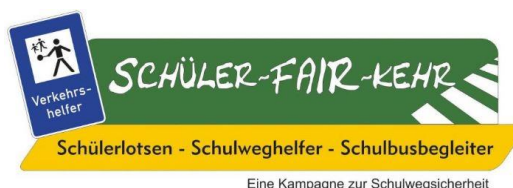
Abbildung 7 Gib Acht im Verkehr - Schüler-Fair-Kehr

Schülerlotsen können helfen, Schulwege sicherer zu machen. Wenn Sie Freiwillige aus der Schülerschaft (der Klassenstufe 7) oder aus der Elternschaft haben, können wir die Ausbildung zum Schülerlotsen oder Schulwegbegleiter durchführen.