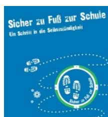
Abbildung 7 Stuttgart - Aktion "Sicher zu Fuß zur Schule"

Die Straßenverkehrsbehörde der Stadt Stuttgart erarbeitet und aktualisiert unter Beteiligung des Polizeipräsidiums Stuttgart (Verkehrsprävention) Schulwegempfehlungen für Grundschulen und stellt diese den Eltern als Schulwegpläne in Papierform und im Internet zur Verfügung.