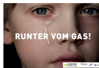
Abbildung 2 - DVR e. V. - RUNTER VOM GAS!

Selbst wenn in Stuttgart überhöhte Geschwindigkeit als Hauptunfallursache im Vergleich zum ländlichen Raum in der Rangliste keinen absoluten Spitzenplatz einnimmt, lohnt es sich allemal, das Thema im Rahmen polizeilicher Präventionsveranstaltungen anzusprechen, um alle Zuhörende darin zu bestärken, ein Fahrzeug mit angepasster Geschwindigkeit zu bewegen. Entgegen dem weitverbreiteten Gefühl, dass es sich bei einer zulässigen Höchstgeschwindigkeit um diejenige dreht, die mindestens erreicht werden muss, handelt es sich tatsächlich um das Tempo, das auch unter günstigsten Umständen nicht überschritten werden darf 1 . Das bedeutet, dass Sie nicht zuletzt bei Dunkelheit und schlechter Witterung Ihre Geschwindigkeit anpassen müssen, um beispielsweise einen Fußgänger oder Radfahrer rechtzeitig erkennen zu können.