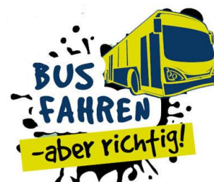
Abbildung 6 Gib Acht im Verkehr – „Bus fahren – aber richtig!“

Mit zunehmender Reife und unter dem Eindruck falscher Vorbilder wächst die Risikobereitschaft und frühere Selbstverständlichkeiten, wie das Tragen