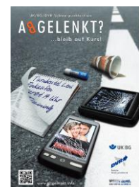
Abbildung 1 - DVR e.V. - ABGELENKT? ... bleib auf Kurs!

Vom Verkehrsgeschehen durch verkehrsfremde Tätigkeiten (bspw. Bedienung eines Smartphones) abgelenkte Personen gefährden andere und sich selbst. Der Mensch wird immer Fehler machen; für Ablenkung in der hier beschriebenen Art und Weise gibt es aber keine Entschuldigung!