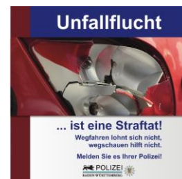
Abbildung 4 Gib Acht im Verkehr „Unfallflucht ist eine Straftat“

Immer wieder passiert es, dass sich jemand, selbst bei Schulwegunfällen mit verletzten Kindern, unerlaubt vom Unfallort entfernt. Auch wenn z. B. ein Kind nach einem Unfall sagt, dass nichts passiert sei, melden Sie den Vorfall unbedingt der Polizei, denn unter dem Eindruck eines zutiefst erschreckenden Zusammenstoßes sind Schmerzen ggf. noch nicht spürbar.