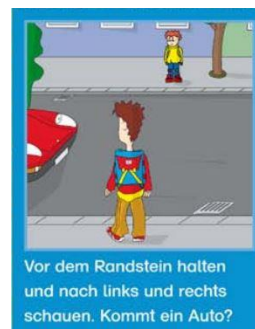
Abbildung 8 Gib Acht im Verkehr Kinderforum

Am Zebrastreifen haben zu Fuß Gehende Vorrang. Sie und Ihr Kind sollten hier damit rechnen, dass aus den unterschiedlichsten Gründen nicht alle, die sich fahrenderweise fortbewegen, anhalten. Nehmen Sie nach Möglichkeit Blickkontakt mit Ihrem Gegenüber im Fahrzeug auf und warten Sie, bis die Fahrzeuge angehalten haben, bevor Sie losgehen. Beim „Kinderfußgängerschein“ lernen die Kinder den „Zebrastreifen-Trick“, um hier besser gesehen zu werden und dem Fahrverkehr zu verdeutlichen, dass sie den Zebrastreifen benutzen möchten: Sie zeigen mit dem ausgestreckten Arm in die Richtung, in die sie gehen wollen. Aber bitte nur am Zebrastreifen!