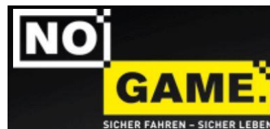
Abbildung 14 Gib Acht im Verkehr - "No Game"

Der Verkehrsprävention in dieser Zielgruppe kommt durch die Schwere der Unfälle besondere Bedeutung zu. Über Aktivitäten an weiterführenden Schulen und Berufsschulen ist ein Teil der Fahranfänger gut zu erreichen. Nicht zuletzt gilt es, bei jenen ein Gefahrenbewusstsein zu wecken, die als Mitfahrende Einfluss auf eine risikobehaftete Fahrweise nehmen können. Weitere Optionen bieten moderne Medien, 8 die zukünftig verstärkt genutzt werden. Klicken Sie sich doch öfter mal rein unter https://ppstuttgart.polizei-bw.de oder in den Social-Media-Kanälen.