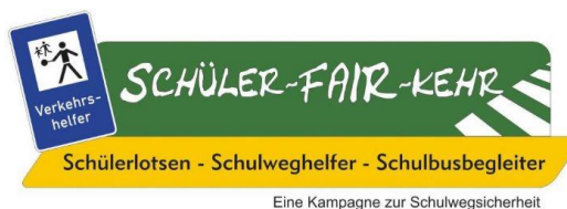
Abbildung 7 Gib Acht im Verkehr - Schüler-Fair-Kehr

Schülerlotsen können helfen, Schulwege sicherer zu machen. Wenn Sie Freiwillige aus der Schülerschaft (der Klassenstufe 7) oder aus der Elternschaft haben, können wir die Ausbildung zum Schülerlotsen oder Schulwegbegleiter durchführen.