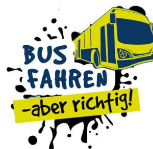
Abbildung 6 Gib Acht im Verkehr – „Bus fahren – aber richtig!“

Mit zunehmender Reife und unter dem Eindruck falscher Vorbilder wächst die Risikobereitschaft und frühere Selbstverständlichkeiten, wie das Tragen eines Fahrradhelms, werden in Frage gestellt oder abgelegt. Bestärken Sie Ihr Kind in seinem