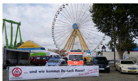
Abbildung 3 Präventionsstand des PP Stuttgart beim Volksfest

Bekanntermaßen beeinträchtigt der Konsum von Alkohol und Drogen die Fahrtauglichkeit. Medikamente und Müdigkeit können ähnliche Auswirkungen haben. Es ist unverantwortlich, aufgrund eigener Bequemlichkeit trotz beeinträchtigter Fahrtauglichkeit die Sicherheit der Mitmenschen aufs