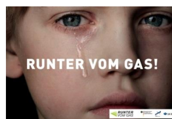
Abbildung 2 - DVR e. V. - RUNTER VOM GAS!

Selbst wenn in Stuttgart überhöhte Geschwindigkeit als Hauptunfallursache im Vergleich zum ländlichen Raum in der Rangliste keinen absoluten Spitzenplatz einnimmt, lohnt es sich allemal, das Thema im Rahmen polizeilicher Präventionsveranstaltungen anzusprechen, um alle Zuhörende darin zu bestärken, ein Fahrzeug mit angepasster Geschwindigkeit zu bewegen. Entgegen dem weitverbreiteten Gefühl, dass es sich bei einer zulässigen Höchstgeschwindigkeit um diejenige dreht, die mindestens erreicht werden muss, handelt es sich tatsächlich um das Tempo, das auch unter günstigsten Umständen nicht überschritten werden darf 1 . Das bedeutet, dass Sie nicht zuletzt bei Dunkelheit und schlechter Witterung Ihre Geschwindigkeit anpassen müssen, um beispielsweise zu Fuß Gehende oder Radfahrende rechtzeitig erkennen zu können.