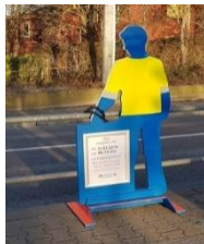
Abbildung 5 Verkehrsmännle des PP Stuttgart

Wenn zu Fuß Gehende einen Unfall verursachen, indem sie beispielsweise ein Rotlicht missachten oder eine Straße unachtsam überqueren, stellen wir für die Dauer von einer Woche ein sogenanntes „Verkehrsmännle“ auf, mit dem auf die Gefahrenstelle hingewiesen und bei Bedarf nach Zeugen gesucht wird.