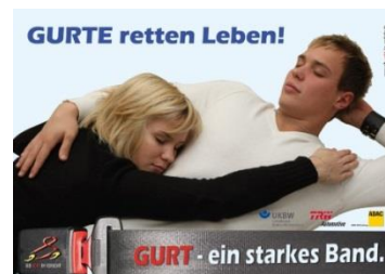
Abbildung 2 - GIB ACHT IM VERKEHR - Gurte retten Leben

Jedes Jahr sterben Menschen im Straßenverkehr, weil sie nicht angegurtet waren (gut ein Viertel der gurtpflichtigen Getöteten). Die Kräfte, die selbst bei geringen Geschwindigkeiten wirken, werden teilweise völlig unterschätzt. So entspricht ein Aufprall mit Tempo 50 einem Sturz aus 10 Metern Höhe. Wer sich mit einem Auto nicht angeschnallt fortbewegt, nimmt diese Gefahr in Kauf. Vernünftigerweise wären jene wohl kaum bereit, bei einer zügigen aber im Vergleich geringen Schrittgeschwindigkeit von 6 km/h ungebremst auf eine Wand zuzugehen, bis es zum Anstoß kommt.