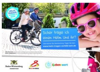
Abbildung 3 - GIB ACHT IM VERKEHR - Helm tragen, Vorbild sein

Diese Einsicht führt auch noch längst nicht in ausreichendem Maße zu dem Entschluss, beim Radfahren einem Helm zu tragen, selbst wenn keine Helmpflicht besteht.