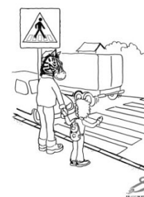
Abbildung 9 Gib Acht im Verkehr - Malblock

Am Zebrastreifen haben zu Fuß Gehende Vorrang. Sie und Ihr Kind sollten hier damit rechnen, dass aus den unterschiedlichsten Gründen nicht alle, die sich fahrenderweise fortbewegen, anhalten. Nehmen Sie nach Möglichkeit Blickkontakt mit Ihrem Gegenüber im Fahrzeug auf und warten Sie, bis die Fahrzeuge angehalten haben, bevor Sie losgehen. Beim „Kinderfußgängerschein“ lernen die Kinder den „Zebrastreifen-Trick“, um hier besser gesehen zu werden und dem Fahrverkehr zu verdeutlichen, dass sie den Zebrastreifen benutzen möchten: Sie zeigen mit dem