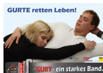
Abbildung 2 - GIB ACHT IM VERKEHR - Gurte retten Leben

Jedes Jahr sterben Menschen im Straßenverkehr, weil sie nicht angegurtet waren (gut ein Viertel der gurtpflichtigen Getöteten). Die Kräfte, die selbst bei geringen Geschwindigkeiten wirken, werden teilweise völlig unterschätzt. So entspricht ein Aufprall mit Tempo 50 einem Sturz aus 10 Metern Höhe. Wer sich mit einem Auto nicht angeschnallt fortbewegt, nimmt diese Gefahr in Kauf. Vernünftigerweise wären jene wohl kaum bereit, bei einer zügigen aber im Vergleich geringen Schrittgeschwindigkeit von 6 km/h ungebremst auf eine Wand zuzugehen, bis es zum Anstoß kommt.