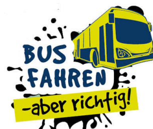
Abbildung 6 Gib Acht im Verkehr – „Bus fahren – aber richtig!“

Mit zunehmender Reife und unter dem Eindruck falscher Vorbilder wächst die Risikobereitschaft und frühere Selbstverständlichkeiten, wie das Tragen