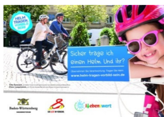
Abbildung 3 - GIB ACHT IM VERKEHR - Helm tragen, Vorbild sein

Diese Einsicht führt auch noch längst nicht in ausreichendem Maße zu dem Entschluss, beim Radfahren einem Helm zu tragen, selbst wenn keine Helmpflicht besteht.