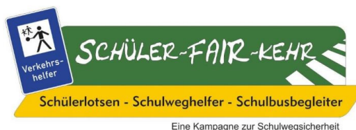
Abbildung 7 Gib Acht im Verkehr - Schüler-Fair-Kehr

Schülerlotsen können helfen, Schulwege sicherer zu machen. Wenn Sie Freiwillige aus der Schülerschaft (der Klassenstufe 7) oder aus der Elternschaft haben, können wir die Ausbildung zum Schülerlotsen oder Schulwegbegleiter durchführen.