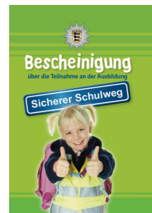
Abbildung 6 Kinderfußgängerschein

Mit theoretischen und praktischen Übungen mit Vor- und Grundschulkindern unterstützen Beamtinnen und Beamte der Verkehrsprävention Eltern dabei, ihren Sprösslingen die Gefahren im Straßenverkehr aufzuzeigen.