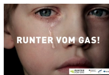
Abbildung 2 - DVR e. V. - RUNTER VOM GAS!

Selbst wenn in Stuttgart überhöhte Geschwindigkeit als Hauptunfallursache im Vergleich zum ländlichen Raum in der Rangliste keinen absoluten Spitzenplatz einnimmt, lohnt es sich allemal, das Thema im Rahmen polizeilicher Präventionsveranstaltungen anzusprechen, um alle Zuhörende darin zu bestärken, ein Fahrzeug mit angepasster Geschwindigkeit zu bewegen. Entgegen dem weitverbreiteten Gefühl, dass es sich bei einer zulässigen Höchstgeschwindigkeit um diejenige dreht, die mindestens erreicht werden muss, handelt es sich tatsächlich um das Tempo, das auch unter günstigsten Umständen nicht überschritten werden darf 1 . Das bedeutet, dass Sie nicht zuletzt bei Dunkelheit und schlechter Witterung Ihre Geschwindigkeit anpassen müssen, um beispielsweise einen Fußgänger oder Radfahrer rechtzeitig erkennen zu können.