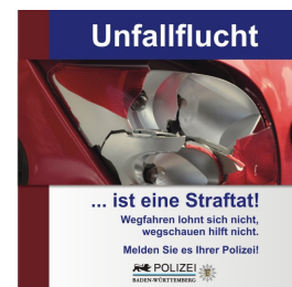
Abbildung 4 Gib Acht im Verkehr „Unfallflucht ist eine Straftat“

Immer wieder passiert es, dass sich jemand, selbst bei Schulwegunfällen mit verletzten Kindern, unerlaubt vom Unfallort entfernt. Auch wenn z. B. ein Kind nach einem Unfall sagt, dass nichts passiert sei, melden Sie den Vorfall unbedingt der Polizei, denn unter dem Eindruck eines zutiefst erschreckenden Zusammenstoßes sind Schmerzen ggf. noch nicht spürbar.