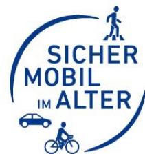
Abbildung 15 DVR e. V. - "Sicher mobil im Alter"

Der demographische Wandel und die Entwicklung der Lebenserwartung lässt den Anteil der Bevölkerungsgruppe „65+“ auch als Verkehrsteilnehmende steigen. Genau wie Kinder, Jugendliche und junge Erwachsene, sind auch Senioren eine Zielgruppe für unsere präventive Verkehrssicherheitsarbeit.