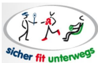
Abbildung 178 - http://www.sicher-fit-unterwegs.de

In der Veranstaltungsreihe „sicher - fit – unterwegs“ erfahren Sie, wie Sie möglichst bis ins hohe Alter Ihre Mobilität und damit Ihre Lebensqualität mit dem Auto, dem Fahrrad, zu Fuß oder mit öffentlichen