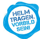
Abbildung 10 Gib Acht im Verkehr – „Helm tragen. Vorbild sein!“

Sorgen Sie bitte dafür, dass es mit einem verkehrssicheren Fahrrad (Licht, Reflektoren, funktionierende Bremsen) und natürlich mit einem passenden Helm unterwegs ist. Vor allem in der dunklen Jahreszeit überprüfen wir vor Schulen, ob die Fahrräder verkehrssicher sind.