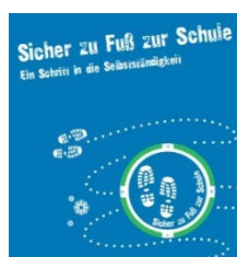
Abbildung 7 Stuttgart - Aktion "Sicher zu Fuß zur Schule"

Die Straßenverkehrsbehörde der Stadt Stuttgart erarbeitet und aktualisiert unter Beteiligung des Polizeipräsidiums Stuttgart (Verkehrsprävention) Schulwegempfehlungen für Grundschulen und stellt diese den Eltern als Schulwegpläne in Papierform und im Internet zur Verfügung.