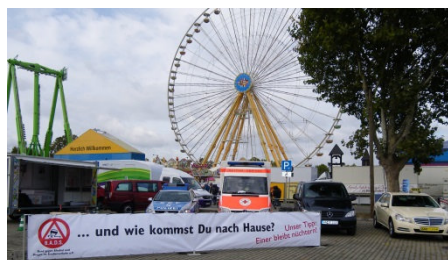
Abbildung 3 Präventionsstand des PP Stuttgart beim Volksfest

Bekanntermaßen beeinträchtigt der Konsum von Alkohol und Drogen die Fahrtauglichkeit. Medikamente und Müdigkeit können ähnliche Auswirkungen haben. Es ist unverantwortlich, aufgrund eigener Bequemlichkeit trotz beeinträchtigter Fahrtauglichkeit die Sicherheit der Mitmenschen aufs