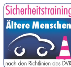
Abbildung 18 – DVR e. V. - Sicherheitstrainings

Neben diesen Pkw-Fahrtrainings können Sie auch ein Fahrradtraining besuchen (siehe „Sicher zu Fuß, mit dem Rad, als Mitfahrer“ – Tipps). Besuchen Sie uns beim ADAC-Pedelec-Aktionstag in der Stuttgarter Innenstadt. Rufen Sie uns an!