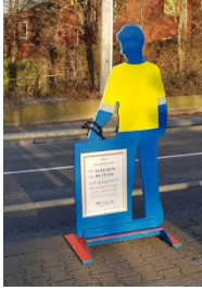
Abbildung 5 Verkehrsmännle des PP Stuttgart

Wenn zu Fuß Gehende einen Unfall verursachen, indem sie beispielsweise ein Rotlicht missachten oder eine Straße unachtsam überqueren, stellen wir für die Dauer von einer Woche ein sogenanntes „Verkehrsmännle“ auf, mit dem auf die Gefahrenstelle hingewiesen und bei Bedarf nach Zeugen gesucht wird.