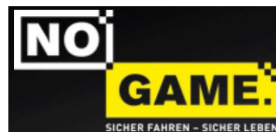
Abbildung 14 Gib Acht im Verkehr - "No Game"

Der Verkehrsprävention in dieser Zielgruppe kommt durch die Schwere der Unfälle besondere Bedeutung zu. Über Aktivitäten an weiterführenden Schulen und Berufsschulen ist ein Teil der Fahranfänger gut zu erreichen. Nicht zuletzt gilt es, bei jenen ein Gefahrenbewusstsein zu wecken, die als Mitfahrende Einfluss auf eine risikobehaftete Fahrweise nehmen können. Weitere Optionen bieten moderne Medien, 8 die zukünftig verstärkt genutzt werden. Klicken Sie sich doch öfter mal rein unter https://ppstuttgart.polizei-bw.de oder in den Social-Media-Kanälen.